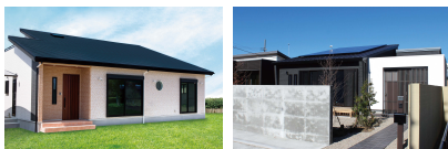
参考 施工実績: 平屋▲

快適なセカンドライフを送るためのもうひとつの住まい、「平屋」もご提案しています。